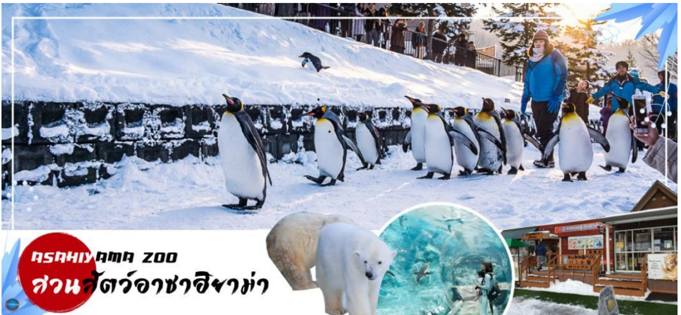
ASAHIYAMA ZOO สวนสัตว์อาซาฮิยาม่า

เมืองอาซาฮิคาว่า - ศาลเจ้าคามิคาวะ - สวนสัตว์อะซาฮิยาม่า - เมืองฟูราโน่ - ลานสโนว์ เวิลด์ (กิจกรรมทางหิมะ) - เมืองซัปโปโร - ย่านซูซูกิโนะ