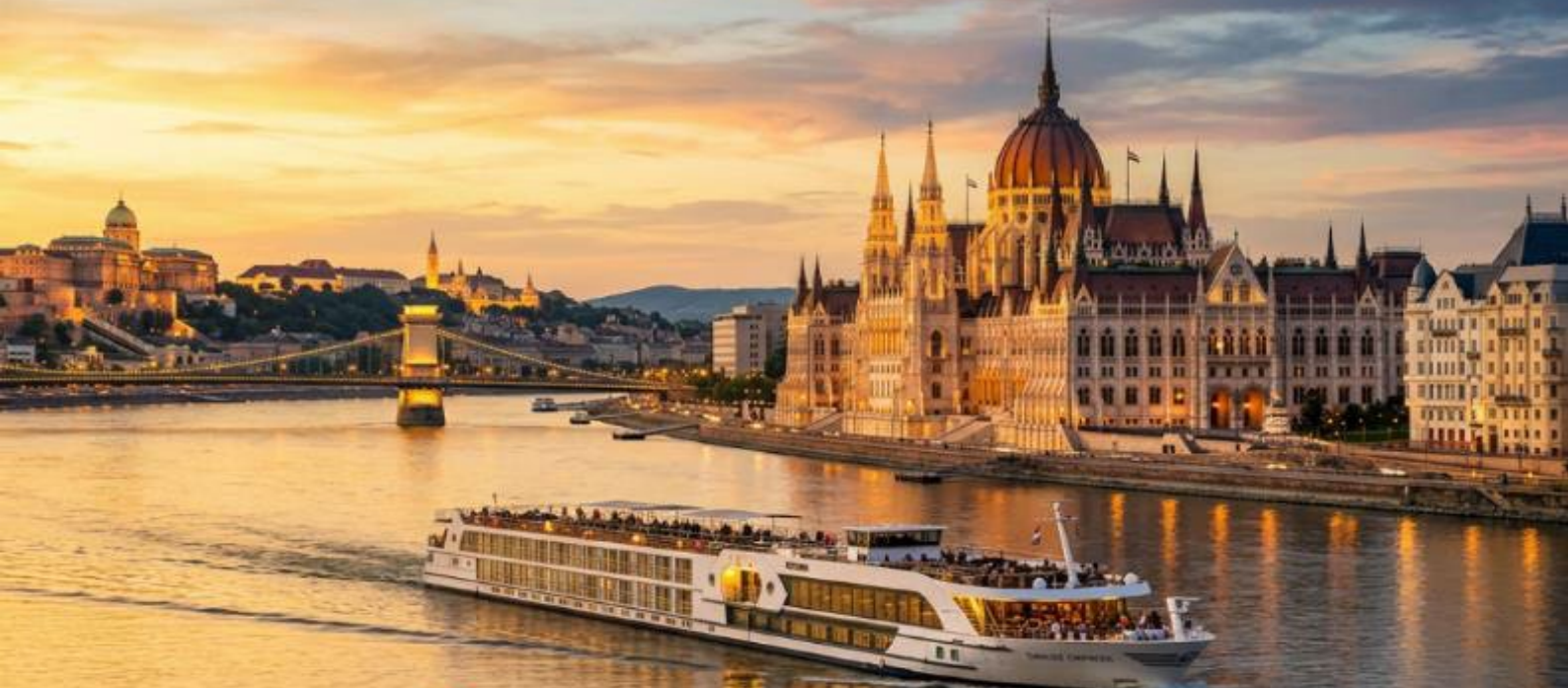
อัลสตัดท์วิวสวยสุดใจ