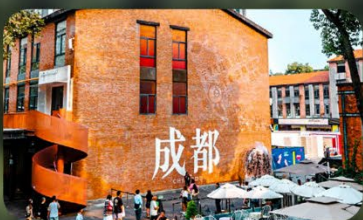
ดงเจียวจี้

HOLIDAY INN EXPRESS HOTEL หรือเทียบเท่า 4 ดาว