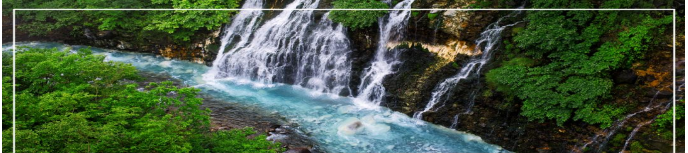
SHIRAHIGE WATERFALL น้ำตกชิราฮิเกะ

วันที่หก เมืองบิเอะ – น้ำตกชิราฮิเกะ – สระอะโออิเคะ หรือ บ่อน้ำสีฟ้า – ทานบุฟเฟต์เมลอน – ทำเนียบรัฐบาลเก่า(ผ่านชม) – หอนาฬิกา(ผ่านชม) – ซุปปิ้งทานุกิโคจิ