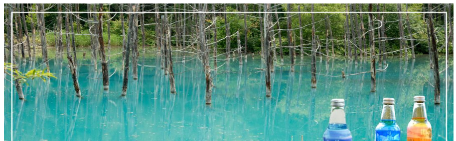
BLUE POND สระอะโออิเคะ

ส่วนมากคนที่จะมาเที่ยว ก็จะเป็นนักท่องเที่ยวถิ่นมากกว่า นักท่องเที่ยวต่างชาติ สาเหตุที่มีชื่อว่า สระอะโออิเคะ (Aoiike) หรือ สระน้ำสีฟ้า (Blue